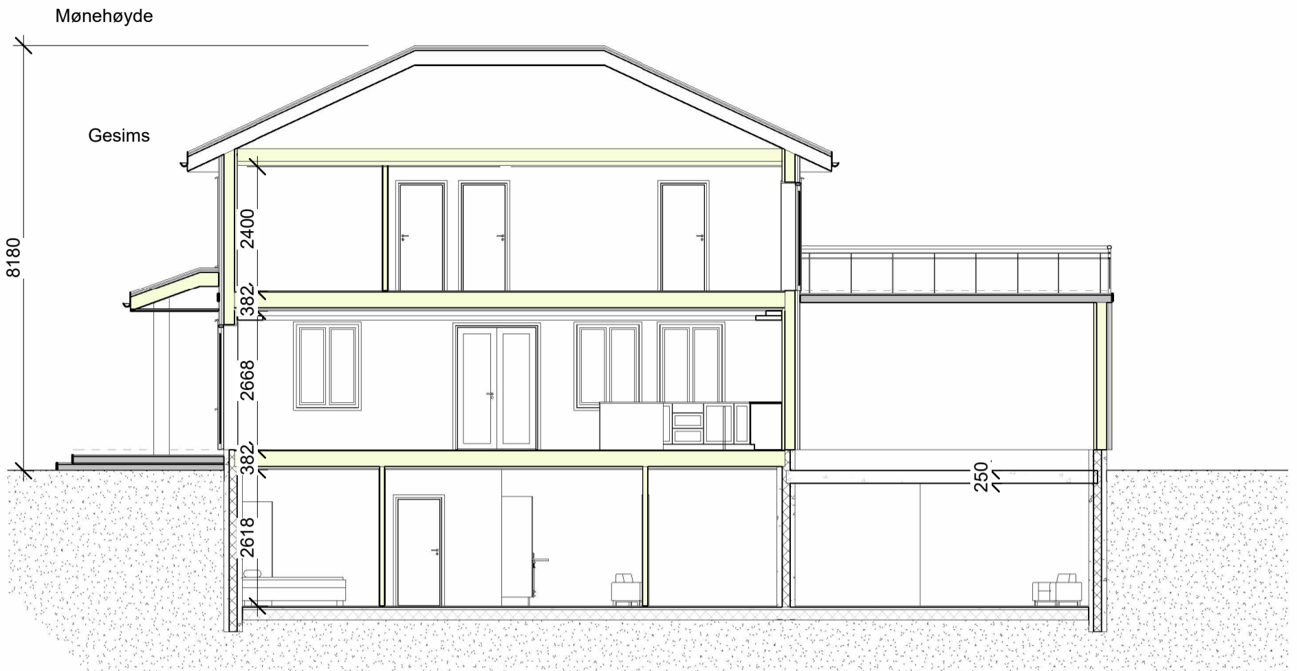
Snitt B 1 : 100